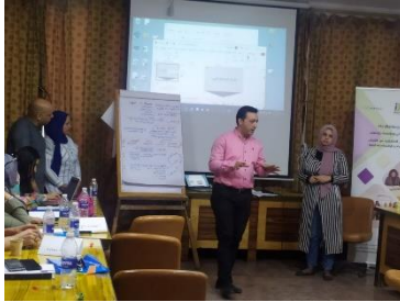
برامج تدريب للمدرسين