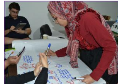
ورش عمل واستشارات للمبدعين الاجتماعيين