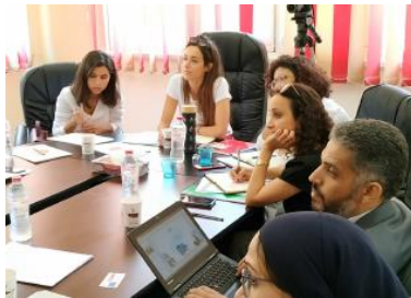
شراكات ونقاشات لتطوير بيئة عمل الابداع الاجتماعي