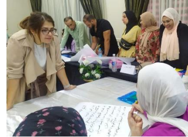
برامج تدريبية للمبدعين الاجتماعيين